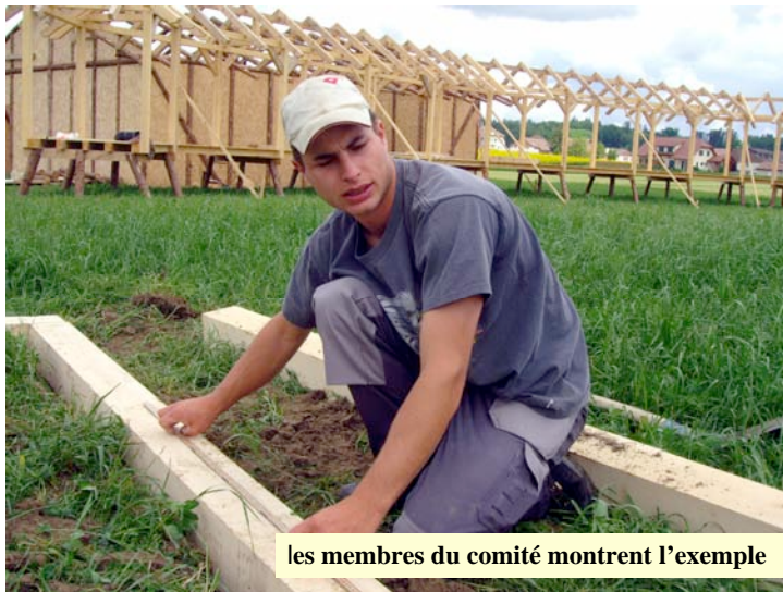
les membres du comité montrent l'exemple

Chaque soir, aura lieu un concours du lancer de la pierre. En effet, pour faire honneur à nos ancêtres, nous avons décidé de vous faire suer un peu lors du jeter de la pierre d'Unspunnen. Bien sûr ce ne sera pas cette mythique pierre qui sera utilisée lors de ce concours, mais une pierre gravée aux couleurs du challenge. Cette dernière nous sera d'une valeur inestimable, chargée de précieux souvenirs et évoquant le succès de cette fête, que j'espère grandiose !