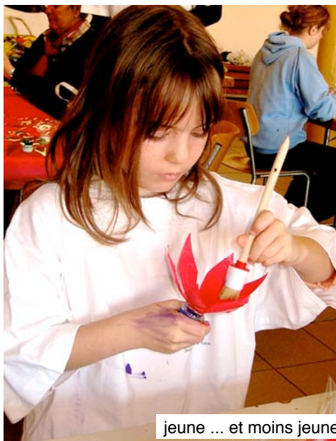
jeune ... et moins jeune: on est dans le coup!