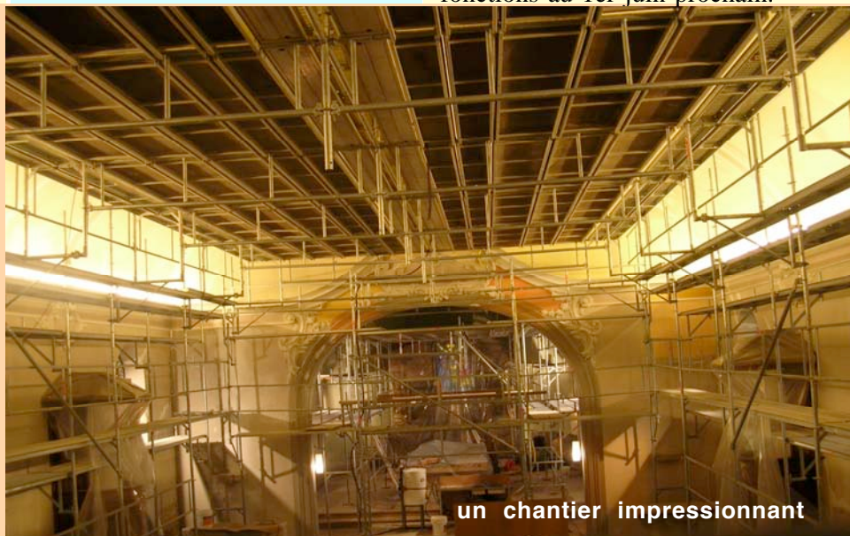
un chantier impressionnant

En collaboration avec les prêtres, pasteurs et laïcs engagés, nous vous invitons d'ores et déjà à réserver la date du 28 septembre 2008 pour une inauguration officielle des lieux rénovés.