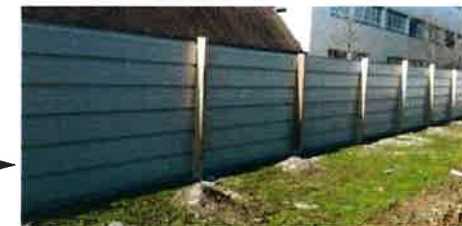
Enceinte de chantier en tôles